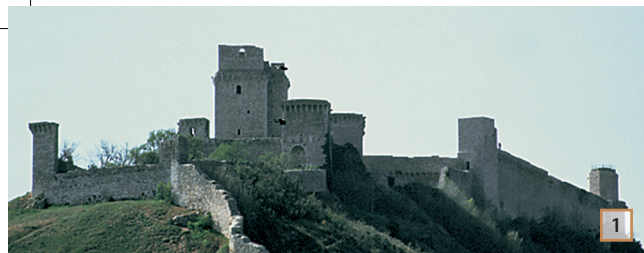
1 Rocca Maggiore