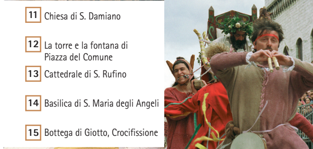
11 Chiesa di S. Damiano